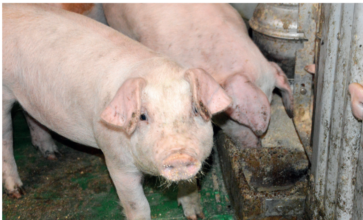
■ I klimastalden anvendes koncentratet Danstart Gentle der er lavere på protein og høj på fiber.

Når det så er sagt, så ligger foderforbruget alligevel lavt i klimastalden hos svinepro-